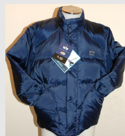
Piumino Tag Down Jacket Vintage